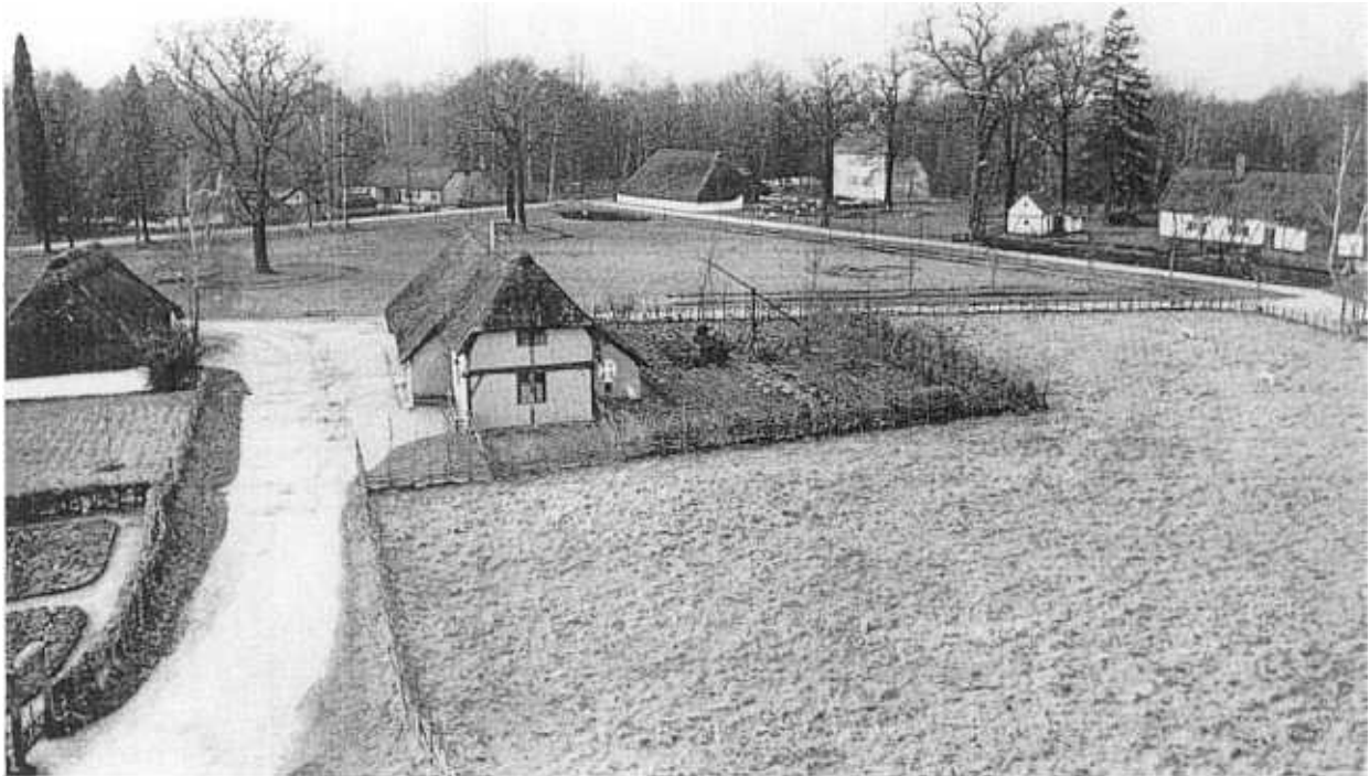
Fig. 3. - Un des grands avantages du Musée de plein air est son aspect didactique, résultant de la confrontation de divers styles dans un espace restreint.

garde du patrimoine rural n'en doit pas moins être entreprise. La campagne et la ville ne sont-elles pas complémentaires ?